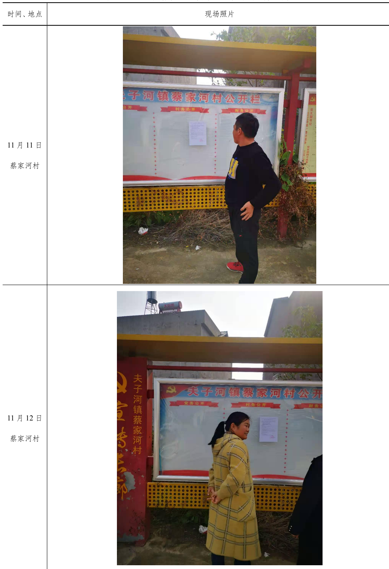
表 3-2 公告张贴的时间、地点及现场照片