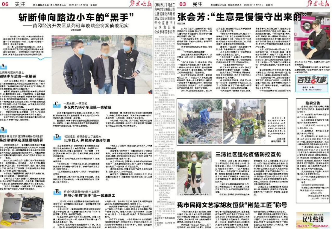
图 3-2 项目征求意见稿公示信息报纸公示照片（2020 年 11 月 12 日）

麻城市金三角养殖有限公司分别于2020年11月12日、2020年11月19日在鄂东晚报上将征求意见稿公开信息进行了公示，鄂东晚报为项目所在地公众易于接触的报纸，符合《环境影响评价公众参与办法》第十一条要求。公示报纸照片见图 3-2 及图 3-3。